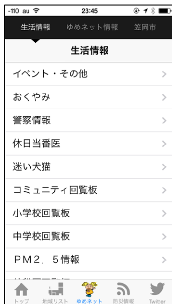
④データ放送・メニュー画面