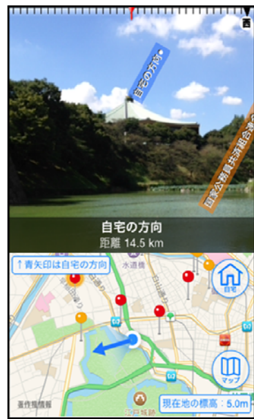
③全国避難所ガイド・AR表示画面