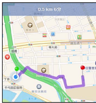
②全国避難所ガイド・ルート表示画面