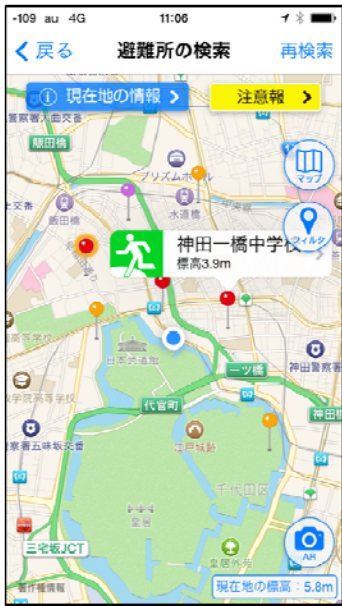
①全国避難所ガイド・検索画面