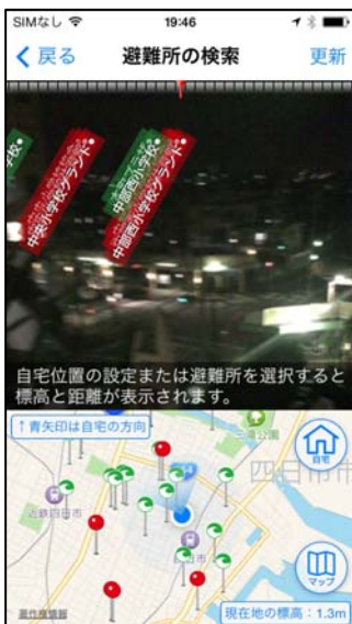
⑦ 避難所検索 (AR 画面)