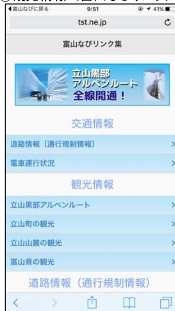
②観光情報 (富山なびリンク)