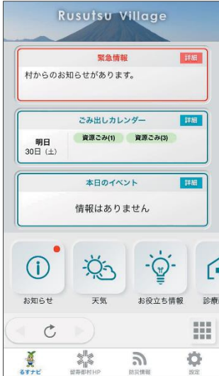
■ アプリトップ画面 (お知らせ・緊急モード)