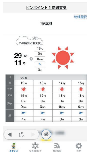
■ ピンポイント天気予報