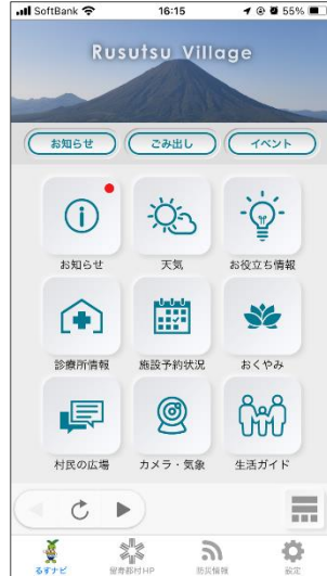
■ アプリトップ画面 (アイコンモード)