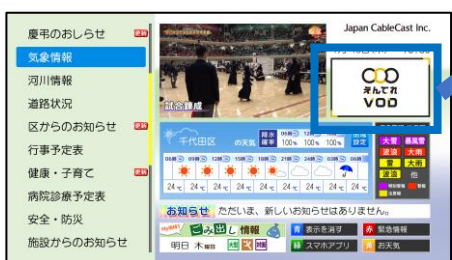
データ放送 トップ画面