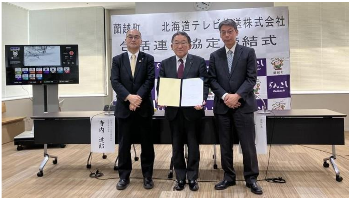
(左から HTB 寺内代表取締役社長、蘭越町 金町長、JCC 大熊代表取締役 COO)

今後も北海道テレビ放送様と連携し、町民の皆様が安心して暮らせるまちづくりをサポートしてまいります。